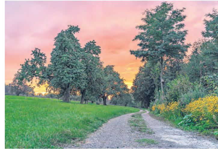
Juni: Raphael Metzger zeichnete einen farbenprächtigen Abend im Schocherswil auf. – Ausgestellt bei Geschenk Art.