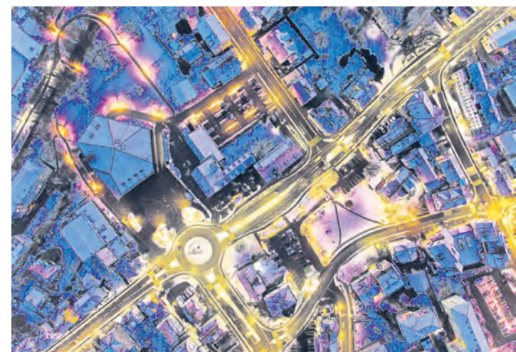
Dezember: Mirco Costa fotografierte über der Arbonerstrasse/Romanshornstrasse. – Ausgestellt bei vinofeel, pellemania.