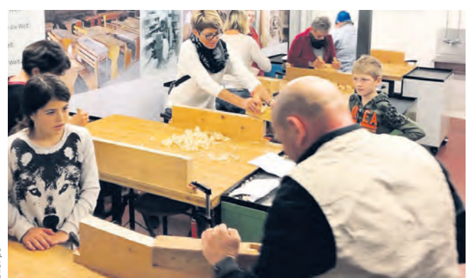
Im Schulmuseum wurde ein altes Handwerk praktiziert.

An der letzten Rundumkunst-Veranstaltung im Schulmuseum fielen die Späne. Dutzende grosse und kleine Besucher konnten unter der künftigen Leitung von Schrei-