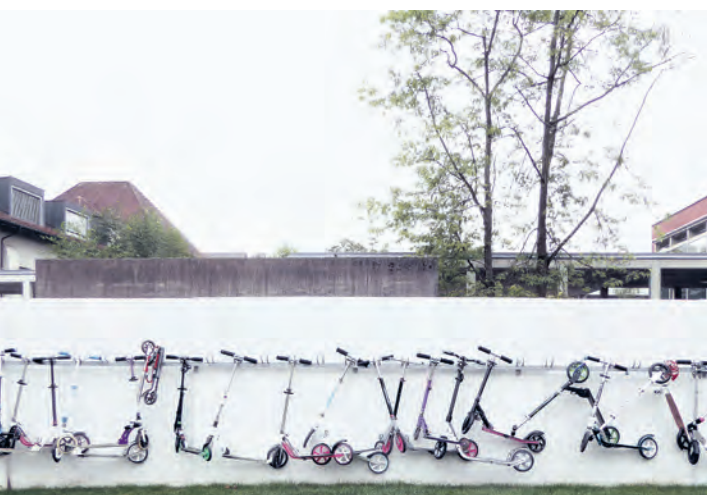
Oktober: Heinz Knöpfli fotografierte ein Trotti-Kunstwerk beim Schulhaus Nordstrasse. – Ausgestellt bei der Optiker Svec GmbH.