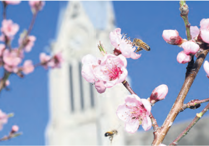
April: Auf Lukas Butschers Bild steht die Natur im Fokus, unscharf im Hintergrund die evangelische Kirche. – Ausgestellt bei Blumen Iseli.