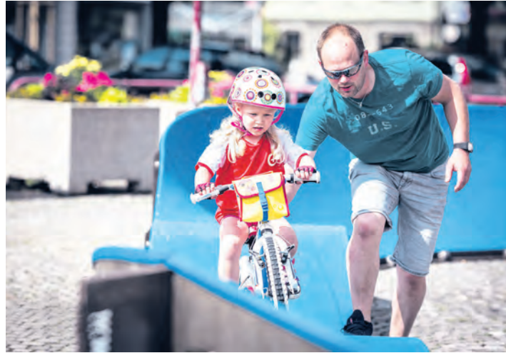
Mai: Pumptrack-Zeit auf dem Marktplatz. – Ausgestellt bei Schulze Sport.