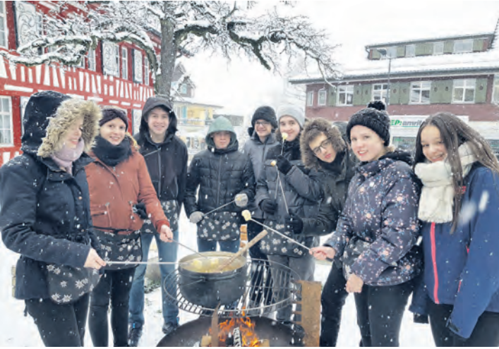
Januar: Julia Rieser fotografierte die winterliche Cevi-Jungschar beim Fondue-Schmaus. – Ausgestellt bei der Schweizerischen Mobiliar.

Die Kulturkommission der Stadt Amriswil hatte zum dritten und letzten Mal zur Teilnahme am Fotowettbewerb aufgerufen, diesmal unter dem Motto «Mis Amriswil läbt». Letzten Dienstag, 12. November, wurde anlässlich einer Vernissage vor dem Kulturforum das Geheimnis um die 13 Bilder (inklusive Titelbild) gelüftet, die im neuen Amriswiler Kalender 2020 einen Platz gefunden haben. Die zwölf Monatsfotos sind unten abgebildet. Zu kaufen gibt es den Amriswiler Kalender 2020 für fünf Franken am Infoschalter im Stadthaus sowie in allen teilnehmenden Amriswiler Fachgeschäften, die jeweils ein Werk noch bis Ende Monat in ihren Schaufenstern ausstellen.