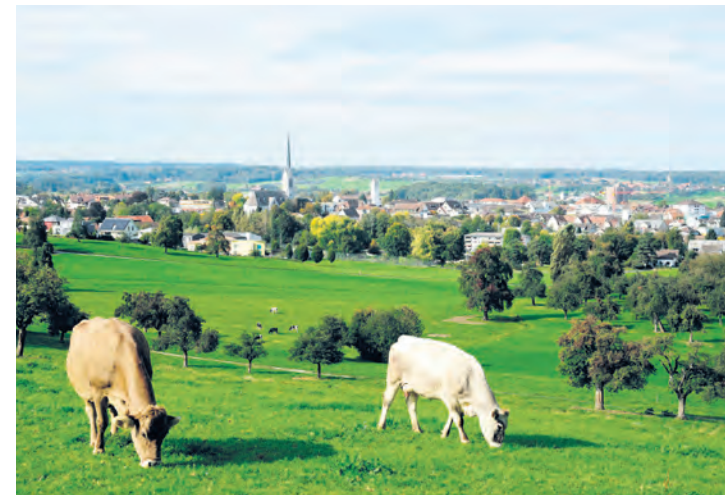
September: Natur pur an der Lerchenbohlstrasse. – Ausgestellt in der Bahnhofdrogerie P. Geisselhardt.