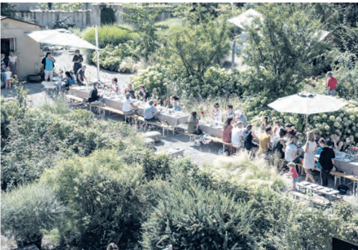
Juli: Fest zum 20-jährigen Bestehen im Villagarten bei Ginkgo. – Ausgestellt in der Zentralapotheke.