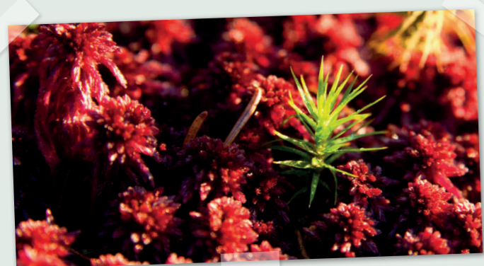
Torfmoos, das für die Entstehung der Hochmoore verantwortlich ist.

Der Sage nach soll das Hudelmoos einst eine ganze Ortschaft verschlungen haben. Heute ist das Hudelmoos ein Moor- und Amphibienlaichgebiet von nationaler Bedeutung, welches Lebensraum für seltene Tiere und Pflanzen bietet. Auf dem Rundweg durch das Naturschutzgebiet erfährt man mehr zu den einzigartigen Bewohnerinnen und Bewohnern des Moor- und Feuchtgebietes, aber auch zu seiner Entstehung, dem Torfabbau und der heutigen Wiederherstellung.