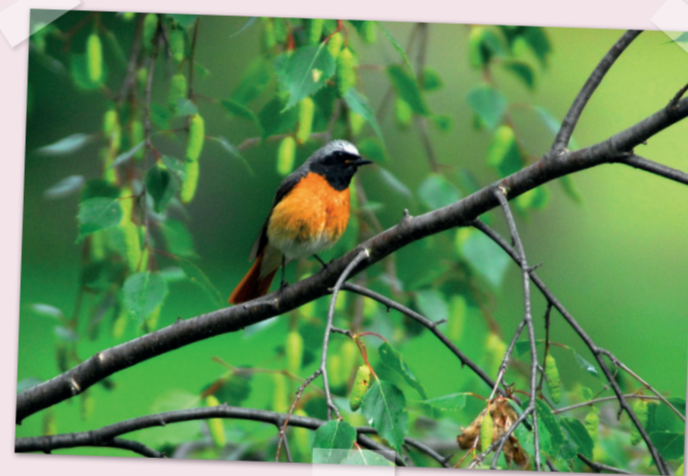
Der Gartenrotschwanz ist ein typischer Bewohner von Hochstamm-Obstgärten.

Der Weg führt von Muolen aus entlang von gut erhaltenen Hochstamm-Obstgärten und durch malerische Weiler. In der Ferne lässt sich mal der Bodensee, dann wieder der Säntis erblicken. Und mit etwas Glück sieht oder hört man hier den Gartenrotschwanz.