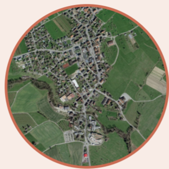
Die landschaftliche Entwicklung rund um Zihlschlacht von 1935 bis 2019.