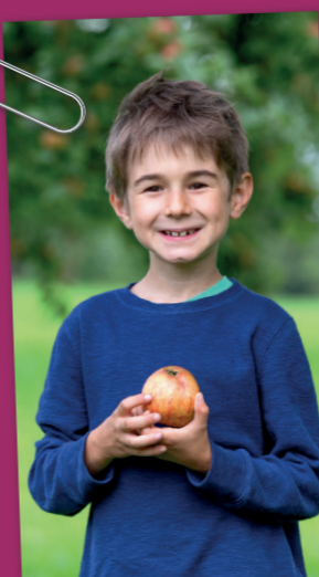
SILVAN, 1. KLÄSSLER, BAUERNSOHN

«Wenn ich mit Papi beim Baumschneiden bin und ich die Hebebühne ganz nach oben schwenke, sehe ich den Säntis und manchmal auch den Bodensee. Zwischen zwei Hochäckern bin ich mal durch eine grosse Pfütze gelaufen.»